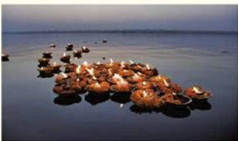
Ofrenda en el río Ganges, India.

Al terminar las actividades comparte tu trabajo con tus compañeros.