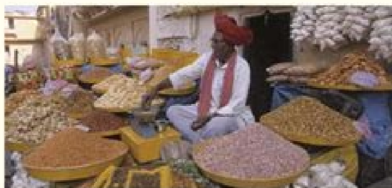
Hombre indio vendiendo especias en la calle.