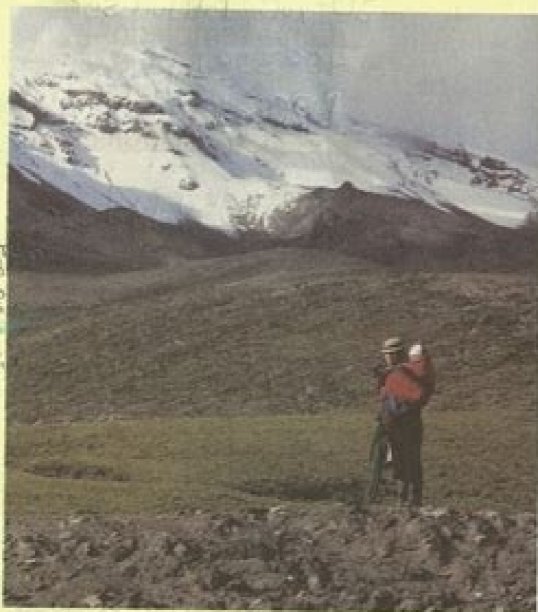
La cumbre más alta de Ecuador, el volcán Chimborazo, alcanza los 6 310 metros de altura, medida desde el nivel del mar.

Para localizar un lugar o región en la superficie terrestre, se utilizan las coordenadas geográficas, como la latitud y la longitud. Localiza las regiones climáticas en el mapa que se encuentra en el Anexo de tu libro, página 189, y realiza lo que se pide a continuación: