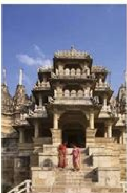
Templo de Chausmukha, en Ranakpur, India.

Recuerda lo que aprendiste en este bloque y realiza el siguiente ejercicio.